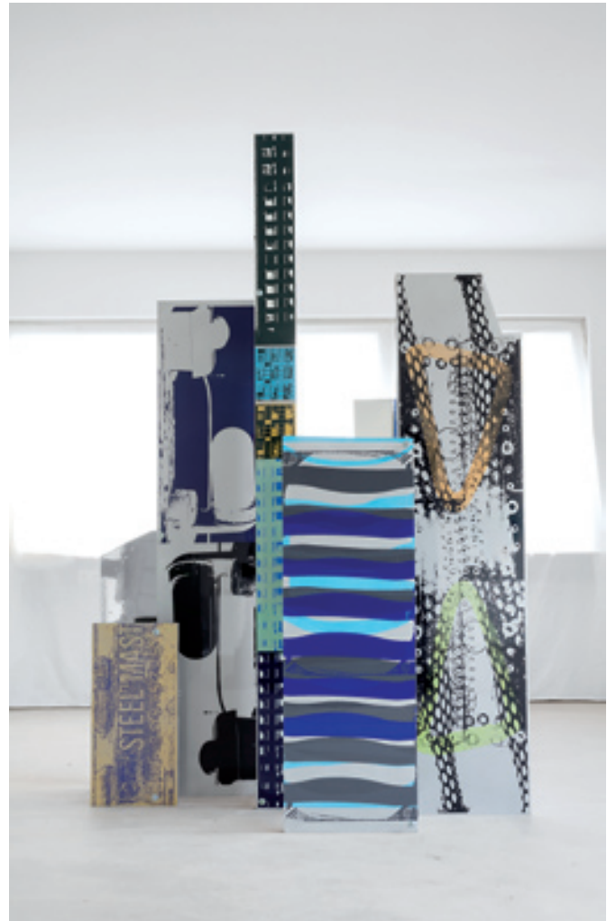
Friederike Oeser; Cut-Out New York New York ; 8 Stelen aus Aluminium-Platten, verschraubt, beidseitig Spray Paint, Autolack, Spiegelfolie, 250 cm x 173 cm x 90 cm, 2016 © Friederike Oeser; Foto: Martin Weiland

der Korea International Art Fair in Seoul; sie stellte in Florenz und Lucca aus, in Kalifornien sowie mit Riga, Vilnius und Krakau auch im östlichen Europa. Bei der Aufsehen erregenden Ausstellung des Contemporary Art Museums im privaten Museum Villa Haiss im badischen Zell am Harmersbach - mit fünfzig führenden internationalen Künstlern der Gegenwart - wurden bezeichnenderweise ihre Werke unter anderem neben Gerhard Richter, Joseph Beuys, Alex Katz, James Rosenquist, Andy Warhol und Otto Piene gezeigt. Unter allen den Werken, die dort zu sehen waren, fielen Friederike Oesers Farb- und Formkombinationen besonders durch die scheinbar unendlichen Kombinationen von ausufernder und zugleich