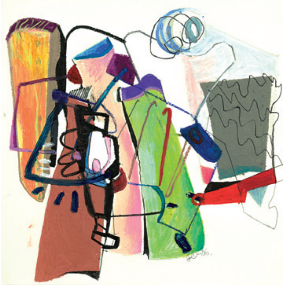
Friederike Oeser; Holz-Stücke, Ölpastell auf Papier, 40 cm x 40 cm, 2006 © Friederike Oeser

welcher Anordnung auch immer, egal aus welcher Perspektive der Betrachter es wahrnimmt, käme einer Konstellation in der Natur auch nicht annähernd nahe. Auf solche Gebilde, wie sie Friederike Oeser schafft, trifft man nicht im Alltag. Sie werden ausschließlich als künstliche Schöpfungen, geradezu aus einer anderen Welt kommend, registriert - und sind doch auf merkwürdige Art und Weise vertraut. Durch ihre, auf einen Blick erfassbaren Strukturen, gleich ob sie als harmonisch oder disharmonisch konnotiert werden, sind sie aus sich heraus in ihrer Gesetzmäßigkeit erkennbar.